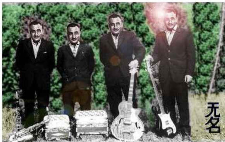
Un des photomontages de présentation du collectif Wu Ming.

M oscou, 1927. Alors que les célébrations des dix ans de la Révolution d'Octobre s'approchent, sur fond de tensions croissantes entre Staline et ses opposants, Alexandre Bogdanov, révolutionnaire bolchevik, scientifique et auteur de livres de science-fiction reçoit la visite d'une étrange jeune fille androgyne, Denni, qui paraît sortir des pages de son roman L'Étoile rouge ... à moins qu'elle ne vienne véritablement de la planète Nacun, née sous sa plume des propos délirants qu'un ancien camarade lui avaient raconté, lui avouant avoir été lui-même, en 1905, enlevé par des Nacuniens. S'instillant avec autant d'intelligence et de connaissances historiques que de finesse littéraire dans les interstices de l'Histoire, Wu